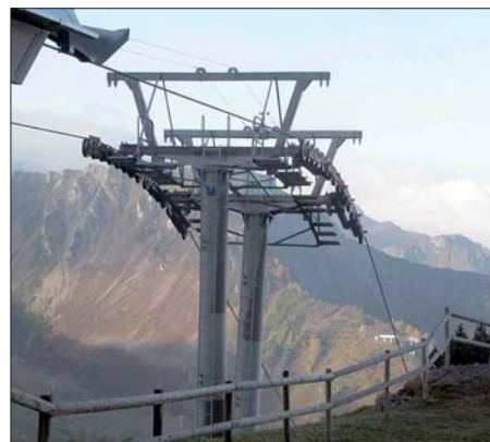
Glücklicherweise überstand das Equipment den Transport ohne Verluste.

wenngleich es schon wieder etwas wärmer geworden war. Vier Stunden später trafen die Beiden in Malbun ein, und nach weiteren zwei Stunden und sieben belegten Sesseln des Liftes war das gesamte Equipment endlich oben auf dem Berg. Das befürchtete Schnee-Problem war keines (mehr).