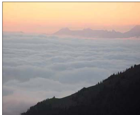
Über den Wolken macht es sich leichter EME?!

fernungen um die 2000 km nicht überbrückt werden konnten. Trotz nur weniger Sternschnuppen – Anfang Oktober gibt es leider keinen guten Schauer – gelang es, wenigstens noch 12 mühsam erarbeitete Stationen zu loggen. Das ODX mit UT6UG war mit 1558 km in Anbetracht der schlechten Topografie ganz beachtlich.